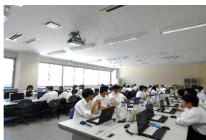
コンピュータ教室